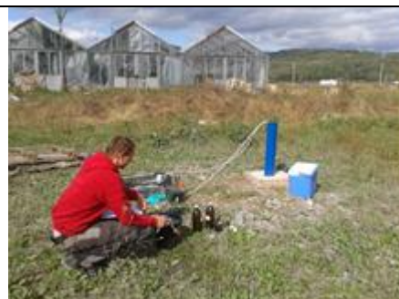
Vzorkovanie podzemných vôd