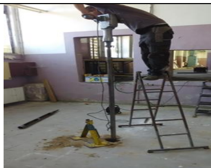
Vrtanie nevstrojeného vrtu – súprava Eijkelkamp